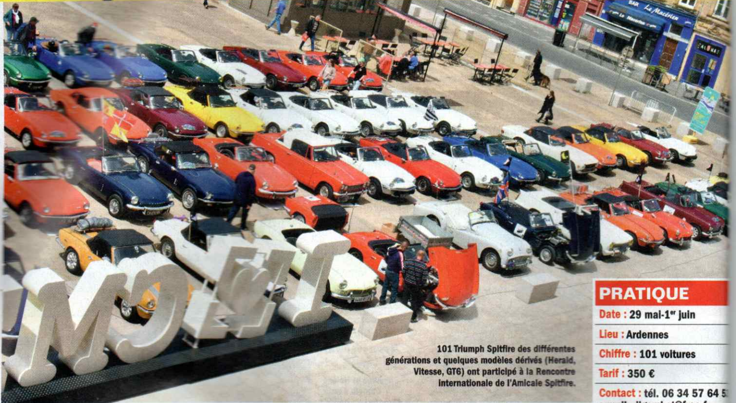
101 Triumph Spitfire des différentes générations et quelques modèles dérivés (Herald, Vitesse, GT6) ont participé à la Rencontre Internationale de l'Amicale Spitfire.